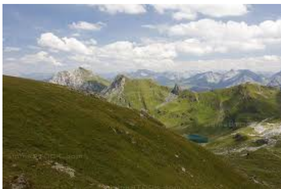
Blick vom Urdenfürkli zum Hörnli