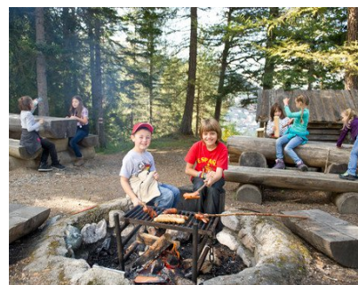
Picknicken und Grillieren